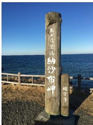
2020年2月27日撮影 目の前に【歯舞群島】が…

まだまだ不慣れで不束者では御座いますが、皆様のお役に立てる様に日々精進して参ります！…ので、どうぞ宜しくお願い致します。