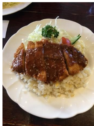
根室市のご当地グルメ 【エスカロップ】👉美味！