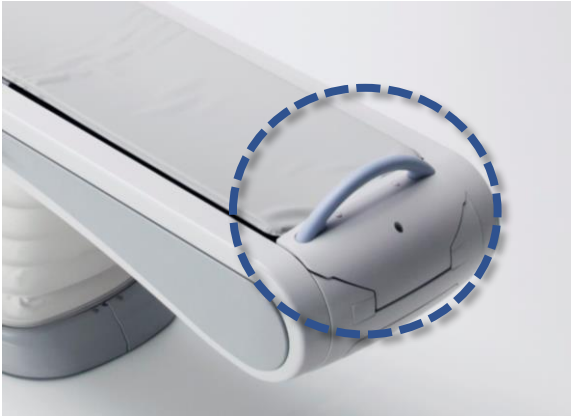
従来装置の寝台後方