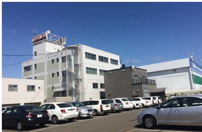
青空の下ずらりと並ぶ営業車と奥に佇む本建屋

今回は営業マンレポート“番外編”ということで、札幌市東区に位置する東芝メディカルシステムズ北海道支社の内部に初潜入したいと思います！