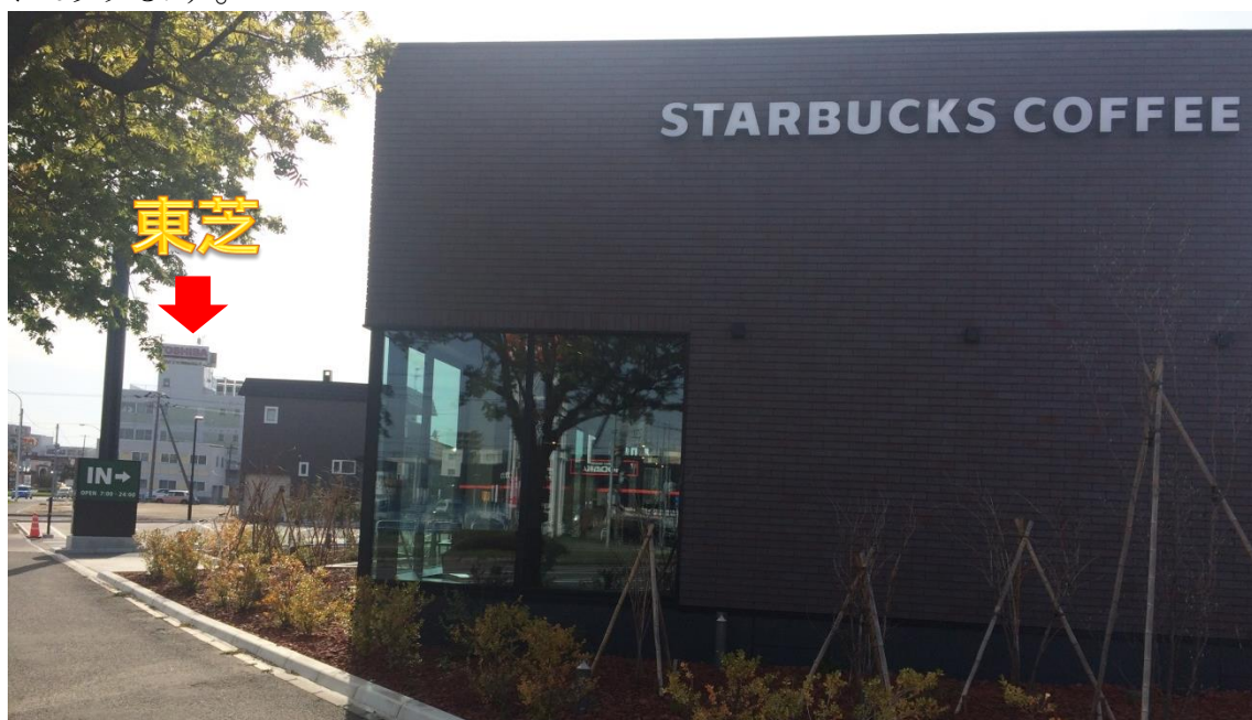
待望のオープンを迎えた☆バックスコーヒー

以上、東芝メディカルシステムズ北海道支社ってどんなところ？ということで今回初めて東芝メディカルシステムズ北海道支社をご紹介させていただきました。大きくも無ければ綺麗でもない北海道支社ですが、少しでも皆様に親近感を抱いていただければ幸いです。最後までお目を通して下さり誠にありがとうございました。今後ともどうぞ宜しくお願いいたします！