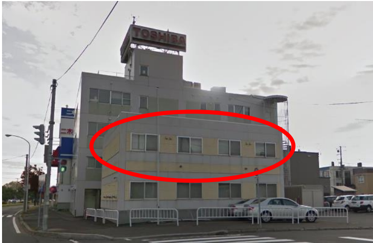
大型トラックが通るたびに揺れる会議室

2階は主に会議室があり、会議や打ち合わせ等はここで行われます。遠友ser会の世話人会もこの会議室で行っています。北海道支社は環状通と呼ばれる大きな道路に面しているため、会社の前は乗用車や